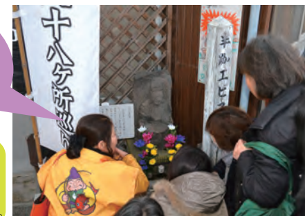
ガイドツアーの様子

恵比須さんの目の高さに合わせてお参りすると恵比須さんの表情が違って見えるかもしれません。